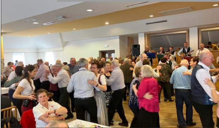
Zahlreiche Besucher und Helfer beim Senioren Gschnas im Gasthaus Kürner