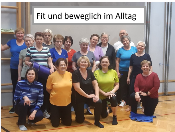
Fit und beweglich im Alltag