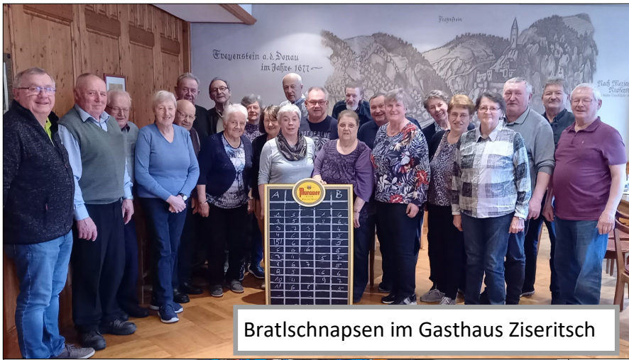
Bratlschnapsen im Gasthaus Ziseritsch