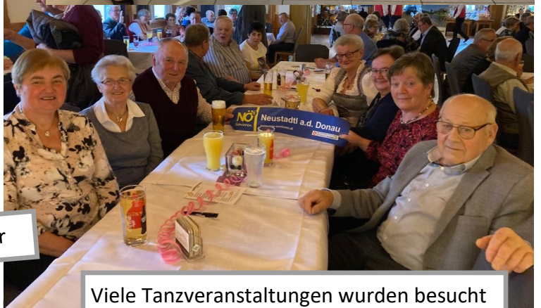
Viele Tanzveranstaltungen wurden besucht