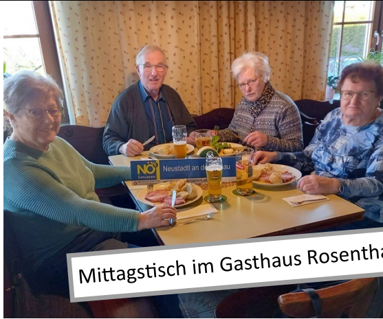
Mittagstisch im Gasthaus Rosenthaler