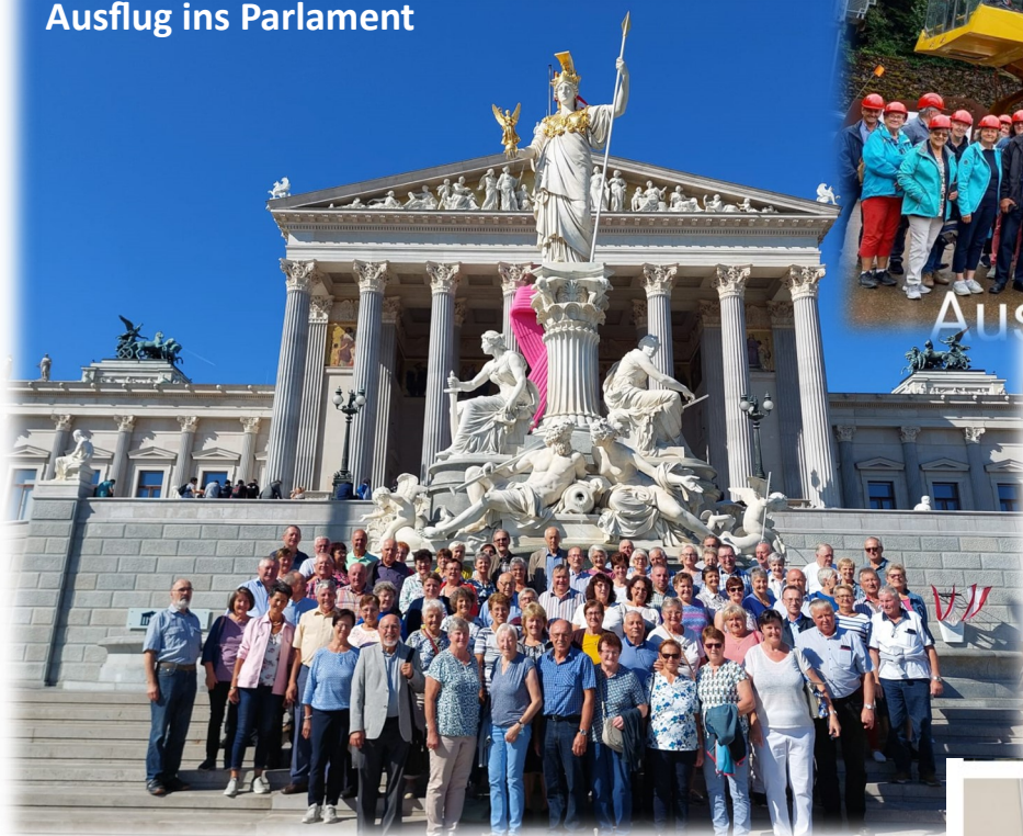
Ausflug ins Parlament