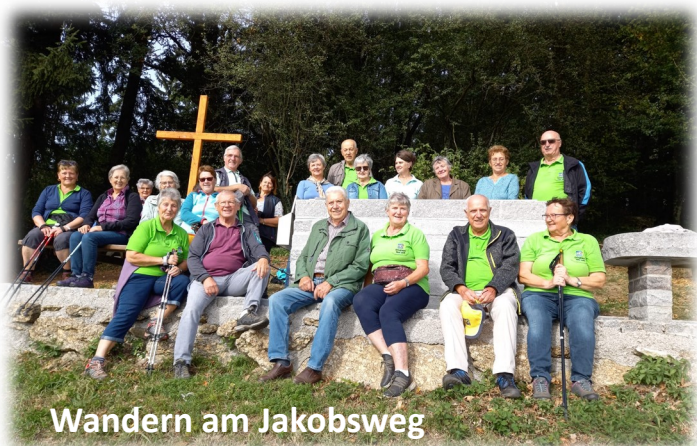
Wandern am Jakobsweg

Herzliche Einladung zum Senioren-Stammtisch Was gibt es Neues? Jeden Mittwoch ab 10 Uhr im Gasthaus Kürner