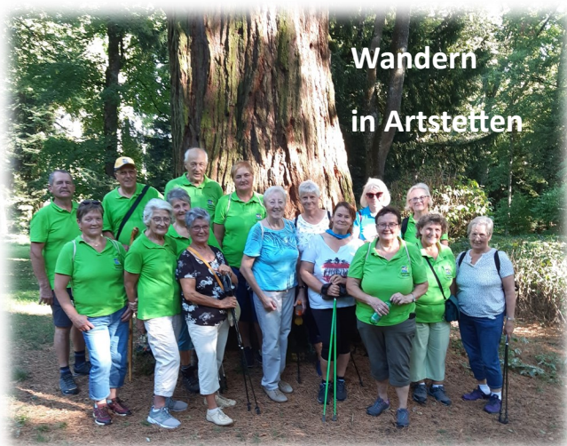
Wandern in Artstetten